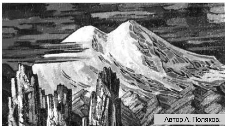
Автор А. Поляков.