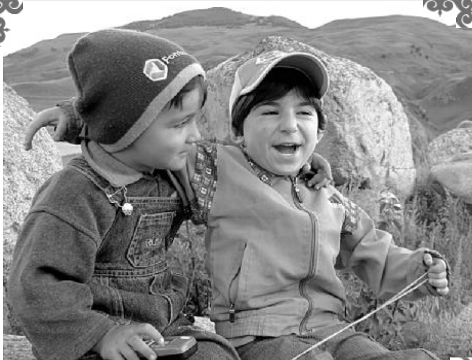
Эжиу этедиле къаяла.