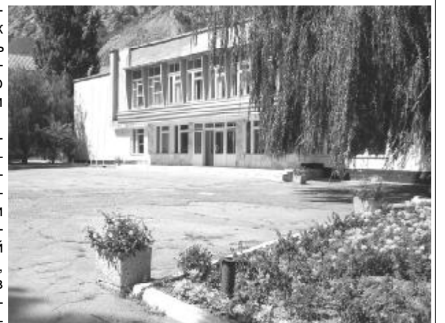
На снимке: МОУ «Гимназия» ждет своих питомцев.

В состав комиссии вошли руководитель районного Управления образования, представители Территориального отдела Территориального управления Федеральной службы по надзору в сфере защиты прав потребителей и благополучия человека в Эльбрусском районе, отряда Государственной противопожарной службы КБР по охране Эльбрусского района, районного комитета профсоюза работников народного образования и науки. В течение нескольких дней они побывали во всех образовательных учреждениях района.