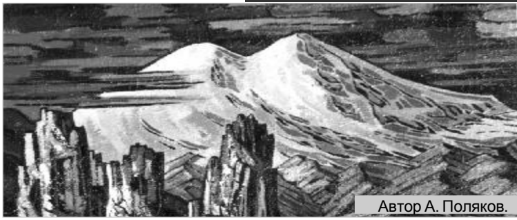
Автор А. Поляков.